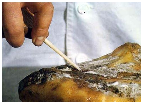
Ilustración 1. Cala de jamón en la zona de unión de la corcusilla.

Estos dos puntos suelen ser los que puede un jamón empezar a estropearse. Por ese motivo, el jamón no se debe calar muchas veces, ya que se deja un agujero abierto por donde entrará aire y aumentará su degradación. En el caso de ser calado, conviene tapar el agujero posteriormente con la misma grasa que tiene el jamón.