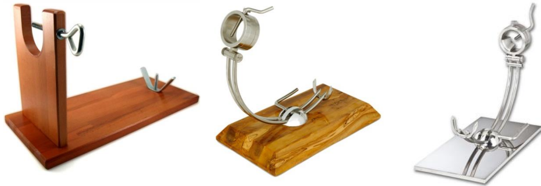
Soporte jamonero madera

Actualmente, en el mercado se pueden encontrar una gran variedad de soportes jamoneros. La gran diferencia estriba sobre todo en los materiales en los que están fabricados, desde madera a acero, los cual encarecerá el precio del soporte.