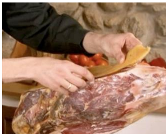
Ilustración 9. Ejemplo de conservación del corte del jamón con tocino.