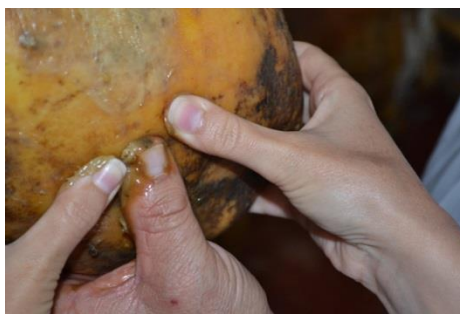
Ilustración 2. Reconocimiento de curación del jamón a través del tacto.

Estas indicaciones prácticas, que aportamos desde Jamón y Punto, son orientativas, y la mejor manera de no equivocarse a la hora de elegir un jamón es dejar a un profesional que elija el jamón por usted. Él, mejor que nadie sabrá el tiempo de curación de sus jamones y las características de los mismos, para poder ofrecerle el mejor producto con el mejor servicio.